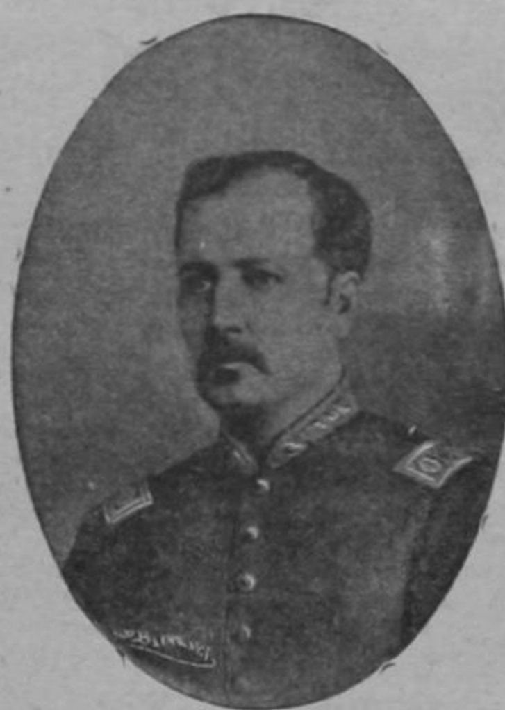
General D. Próspero Fernández Oreamuno.

Hará mañana cuarenta y cuatro años que, en momentos de conmoción pública y calamidad nacional por la movilización militar que se efectuaba tan rápidamente como lo permitían las circunstancias, para repeler las pretensiones del General Justo Rufino Barrios, Presidente de Guatemala, autorizado por su Asamblea para asumir el mando militar de Centro América, y hacer por medio de las armas la unión de las cinco Repúblicas, acaeció el fallecimiento del General Presidente de la República don Próspero Fernández, sucedido en la Villa de Atenas.